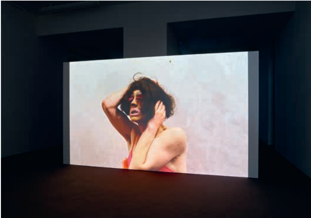
Tobias Zielony, Maskirovka , 2017, Installationsansicht/installation view, JSC ON VIEW, JSC Düsseldorf.