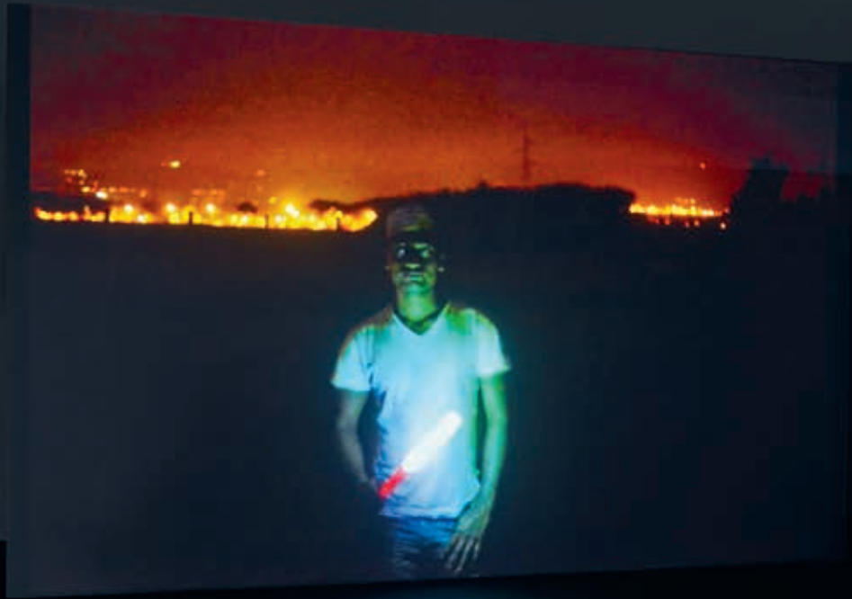
Tobias Zielony, The Street (C.P.A.) , 2013, Installationsansicht/installation view, JSC ON VIEW, JSC Düsseldorf.