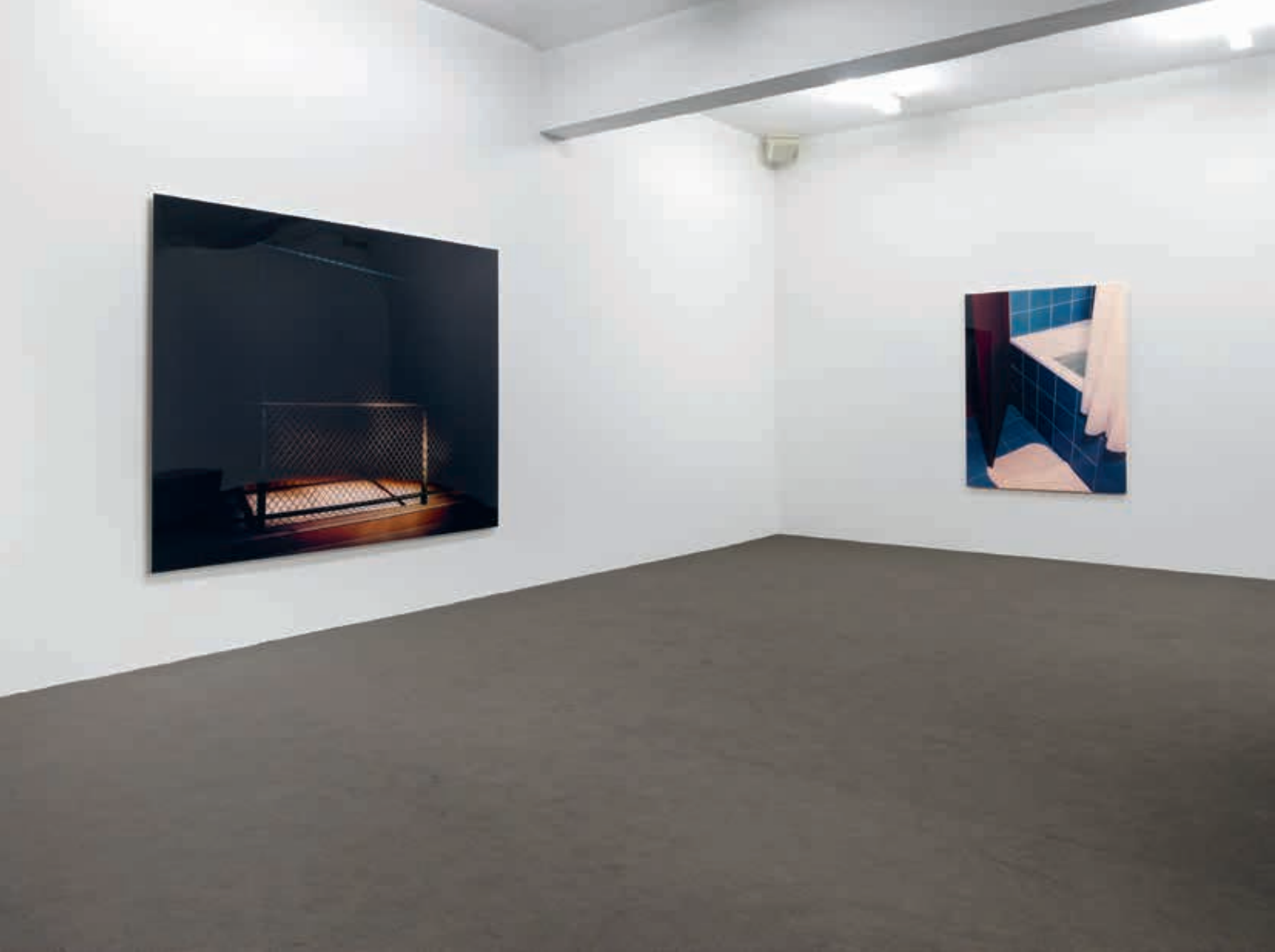
Von links nach rechts/From left to right: Thomas Demand, Zaun/Fence , 2004; Badezimmer/Bathroom , 1997, Installationsansicht/installation view, JSC ON VIEW, JSC Düsseldorf.