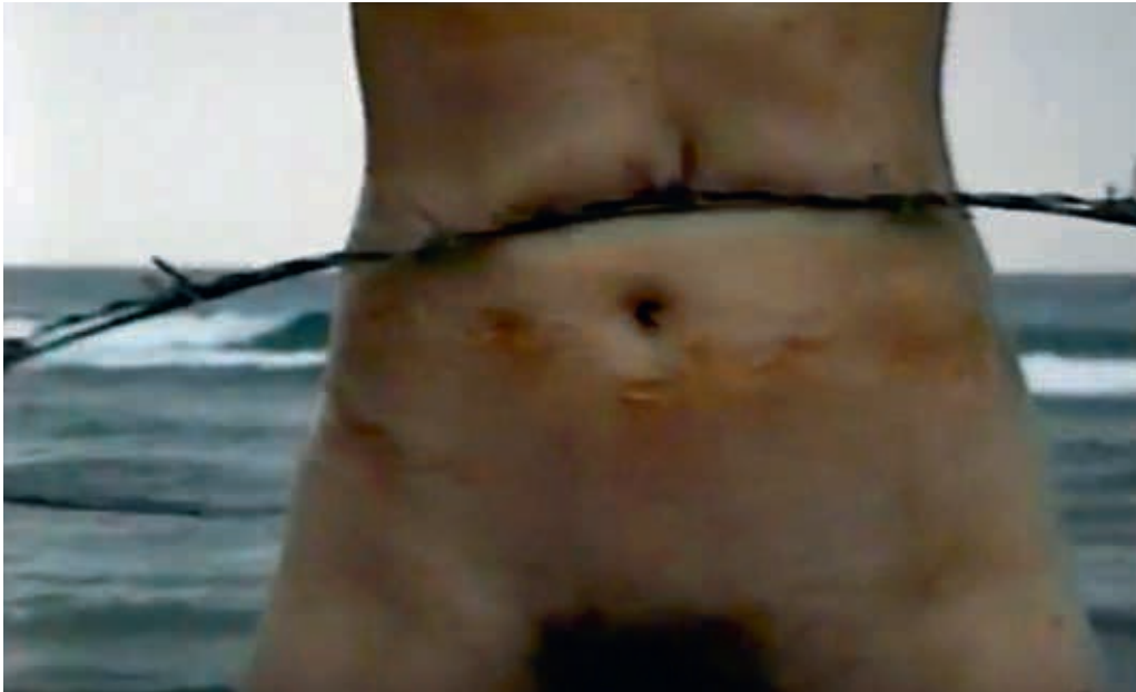
Sigalit Landau, Barbed Hula , 2000, Videostill/video still.