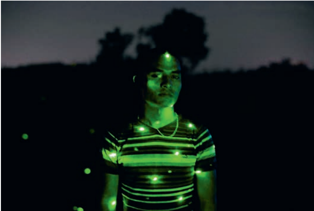
Tobias Zielony, The Street (C.P.A.) , 2013, Videostill/video still.