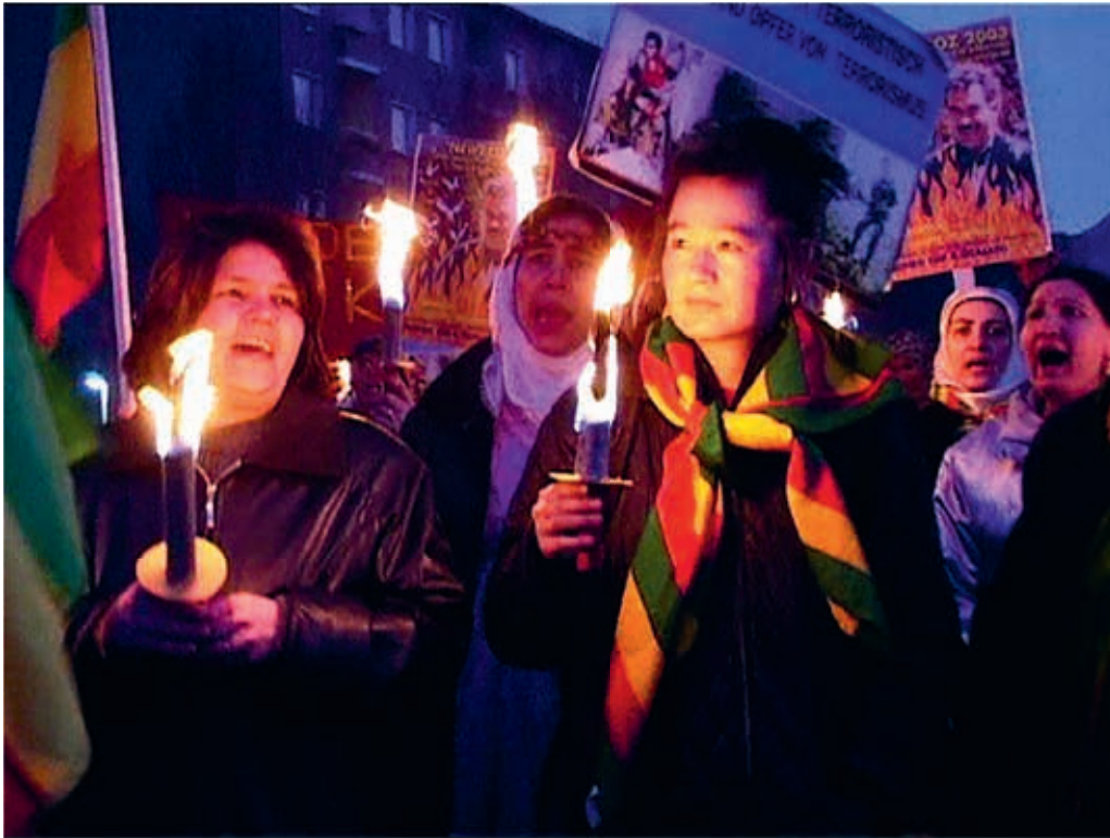
Hito Steyerl, November, 2004, Videostill/video still. Courtesy of the artist, Andrew Kreps Gallery, New York and Esther Schipper, Berlin.