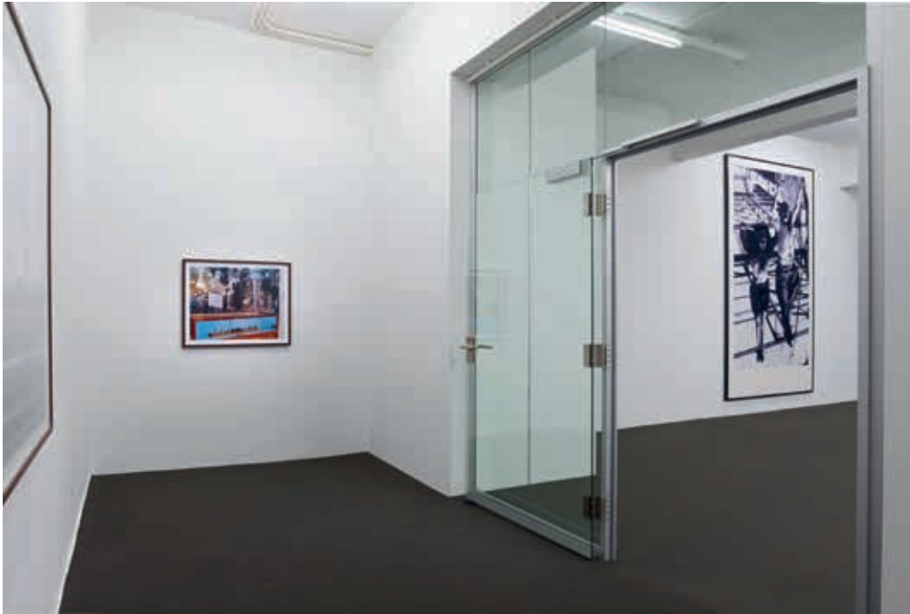
Von links nach rechts/From left to right: Colin Montgomery, Arlington National Cemetery (JFK funeral model) , 2005; Adam McEwen, Untitled (A-Line) , 2002, Installationsansicht/installation view, JSC ON VIEW, JSC Düsseldorf.