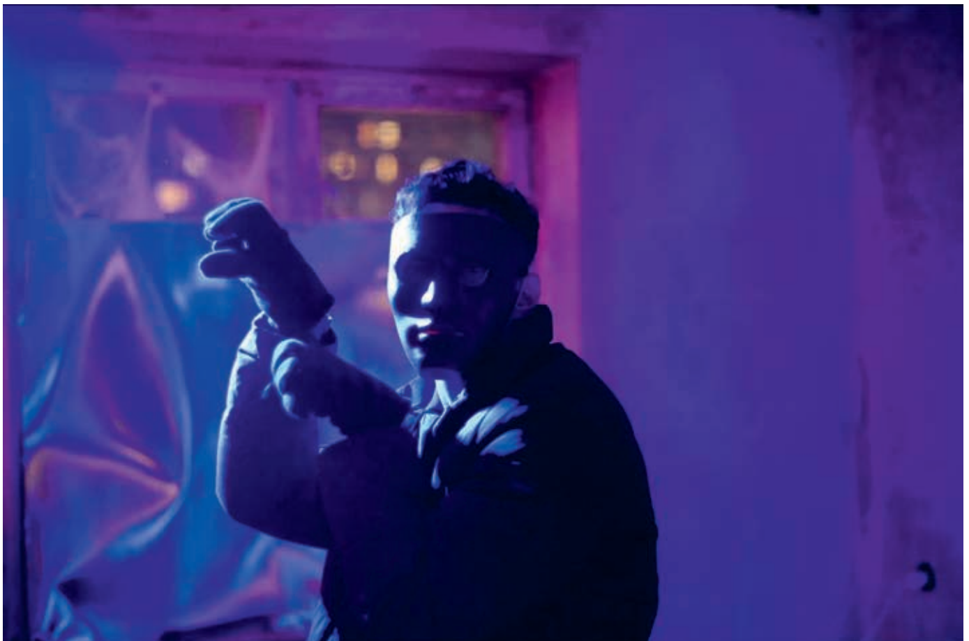
Tobias Zielony, Maskirovka , 2017, Videostill/video still.

Tobias Zielony (born in Wuppertal, Germany, in 1973) is one of the most important representatives of contemporary German photography today. His work is in series that usually focus on adolescents and young adults in their social environment, mostly in public spaces in social or urban peripheries. The artist is more interested in showing the way his subjects stage themselves in front of the camera than in showing their living conditions. Since 2008 the medium of video has taken an increasingly important and independent place in his work as an artist. Practically every one of his photo series since then has been accompanied by an animated video consisting of single images from each photo series mostly without sound.