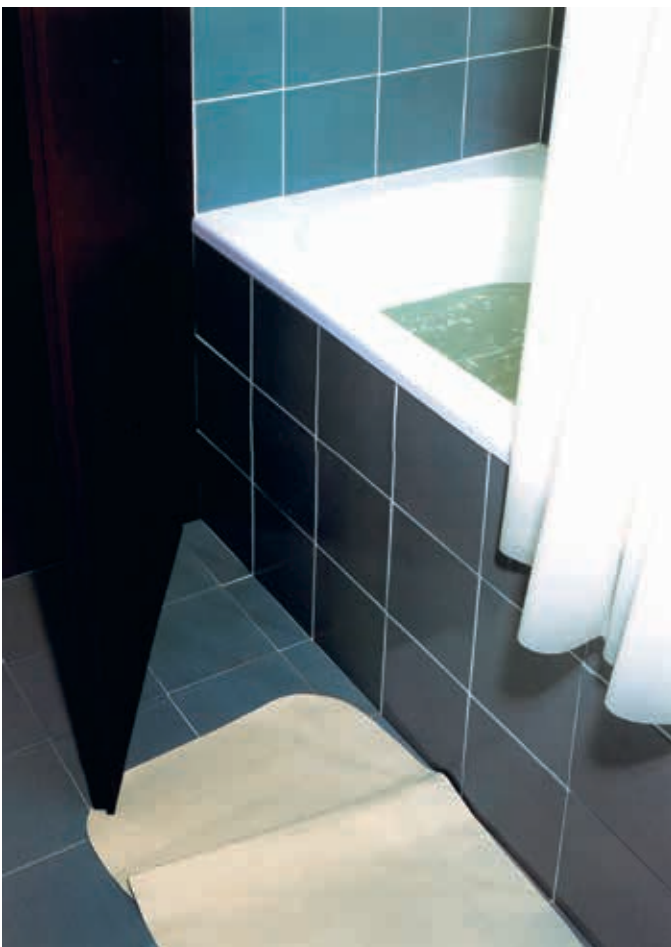
Thomas Demand, Badezimmer/ Bathroom , 1997.

Thomas Demand (born in Munich, Germany, in 1964) is one of the most important contemporary artists today. He works in the media of photography, sculpture, and architecture, which he combines in his work in complex ways. Historical, political, or criminalistic images from his pool of news and archive photographs are his starting point. They frequently depict places, architecture, or rooms of historical significance, in which socially relevant events took place—scenes of events or crimes that were disseminated by the mass media. Using the original image as his guide, Demand builds elaborate life-sized, three-dimensional models out of paper and cardboard. He photographs these ephemeral constructions using precise lighting and a large-format camera and then destroys them.