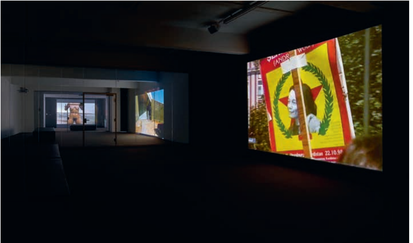
Von links nach rechts/From left to right: Sigalit Landau, Barbed Hula , 2000; Basel Abbas & Ruanne Abou-Rahme, The Incidental Insurgents: The Part About The Bandits (Chapter 2) , 2012/13; Hito Steyerl, November , 2004, Installationsansicht/installation view, JSC ON VIEW, JSC Düsseldorf.